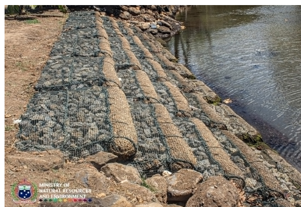
Biolog Filtration System mo le tapu'eina o le suavai mo Fagalii