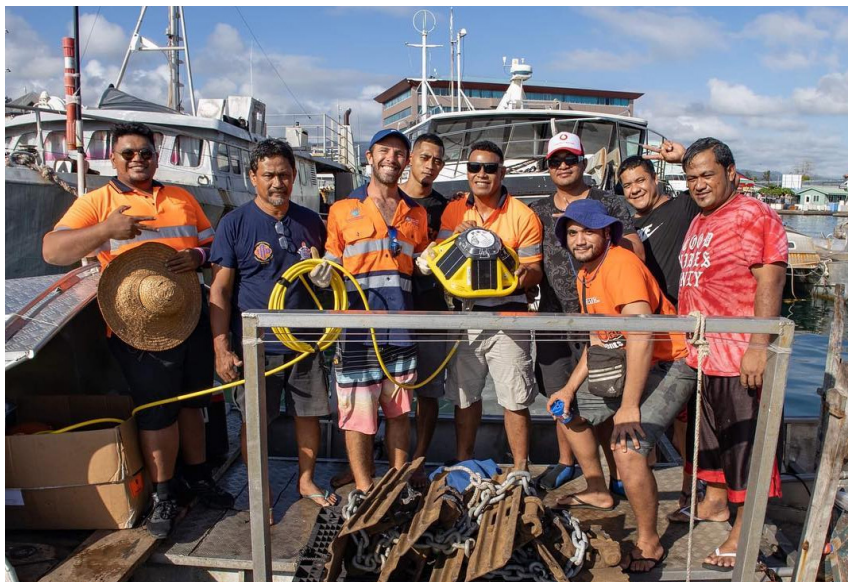
Galuega Faatino mo le Mataituina o le Faavailaauoonaina o Atuvasa

-Ole masinai o Fepuari 2024, sa faatino ai galuega toe faaleleia ole masini oloo taula ile aloalo i Mulinuu. Sa faia lea galuega ao iai i Samoa se aumalaga mai i Kolea e faatino galuega toe faaleleia aemaise ole faatinoina o aooga.