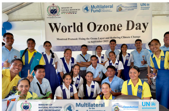
Aso Faapitoa mo le faamanatuina o le Osone i le Lalolagi

Galuega uma i lalo o le ISP Vaega XI sa fa'amāe'aina i le aso 31 o Tesema, 2023, ma sa amatalia le fa'atinoina o le Vaega XII mai le masina o Ianuari 2024. O sini autū nei sa ausia i le piliota fa'a-le-lipoti: