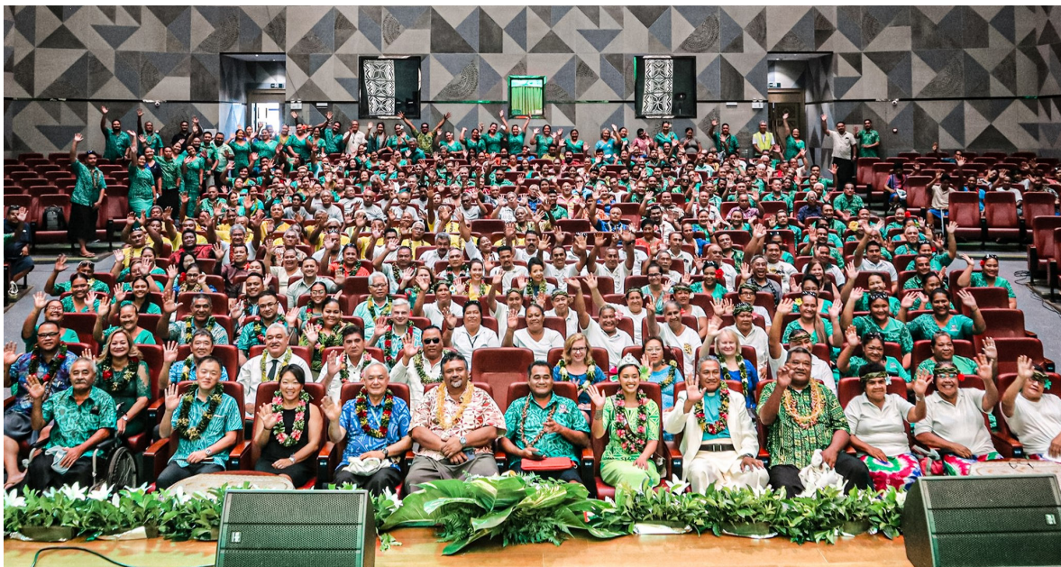
Vaiaso Faapitoa o le Siosiomaga, Novema 2023

O le aufaigaluega a le Vaega e Faafoeina Galuega a le Vaega Maoti e aofia ai: 1 x Ofisa Sinia Autu, 1 x Ofisa Sinia, 2 x Ofisa mo Poloketi, 1 x Ofisa Sili Lagolago.