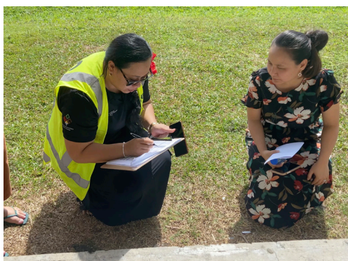
Iloiloga mo le Faaitiitia o Tulaga Lamatia mo Faleaoga