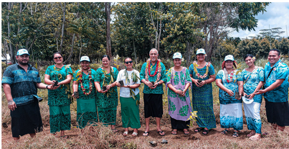
Totogalaau i Vaipouli Savaii, Novema 2023.

E 7 ni laupapa faailoilo sa fausiaina ma faatuina le 5 i Sogi, Togitogiga, Faleolo, Maota and Asau e faalauiloa sini ma faamoemoega o le polokalame o le toe totoina o vaomatua o Samoa. E 2 laupapa faailoilo o lo o faagasolo le fausiaina. O lo o faaauau pea ona tufaina pepa faamatalaga i le mamalu o le atunuu mo le siitia o le silafia ma le tomai i galuega tau vaomatua, Tulafono o Galuega Tau Vaomatua 2011 ma le Polokalame o le 3 Miliona Laau toto 2022 – 2028.